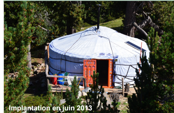
Implantation en juin 2013

Projet de construction co-financé à 60% par :